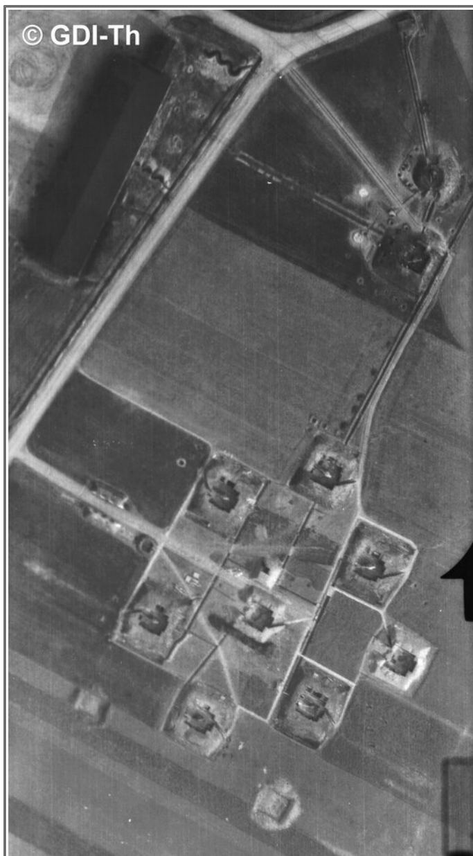
( Luftbild #2: Luftbildausschnitt – Flakstellung Rödigen )

Flak-Stellung: Rödigen – Fliegerhorst Rödigen Batterie/n & Abteilung/en: 1./s. 432 Art der Stellung (o/v/EIS): o Anzahl der Geschütze: 8x 8,8 cm Flak Nachgewiesen, wann: 03./04.1945 Luftwaffenhelfer: aus Jena, Gera und Weida.