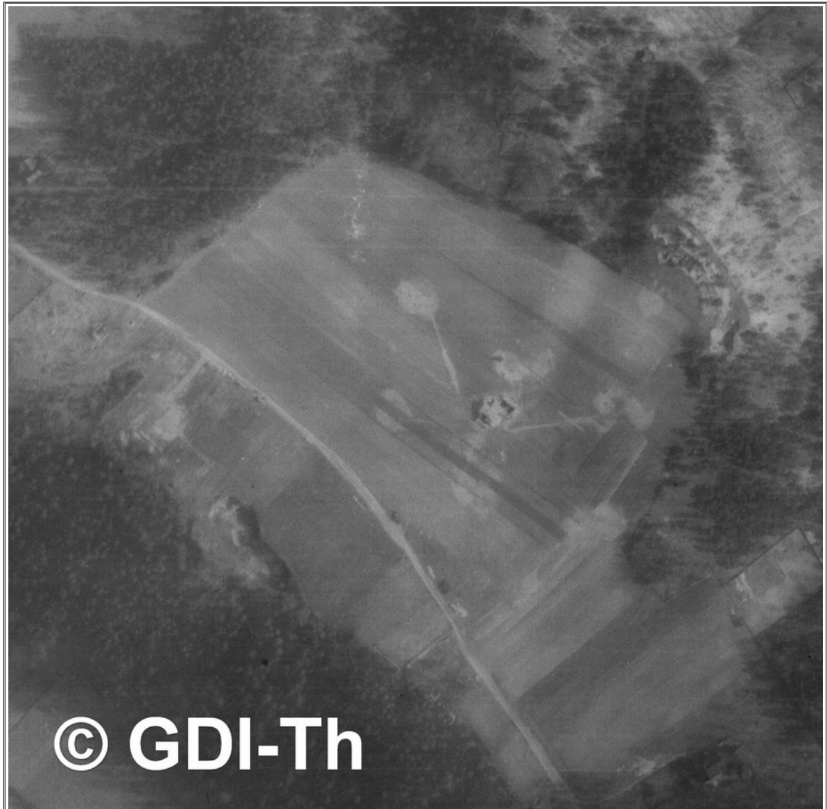
( Luftbild #5: Luftbildausschnitt – Flakstellung Ammerbacher Platte bei Jena )

Flak-Stellung: Ammerbacher-Platte (bei Ammerbach) Batterie/n & Abteilung/en: s. Hei. 212/IV Art der Stellung (o/v/EIS): o Anzahl der Geschütze: 6x 8,8 cm Flak Nachgewiesen, wann: 03./04.1945 Luftwaffenhelfer: aus Jena, Gera und Weida.