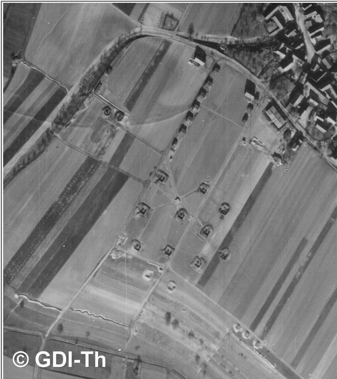
( Luftbild #4: Luftbildausschnitt – Flakstellung Jena-Prießnitz )

Flak-Stellung: Jena-Prießnitz. Batterie/n & Abteilung/en: 4./s. 432 Art der Stellung (o/v/EIS): o Anzahl der Geschütze: 8x 8,8 cm Flak Nachgewiesen, wann: 03./04.1945 Luftwaffenhelfer: aus Jena und Eisenach