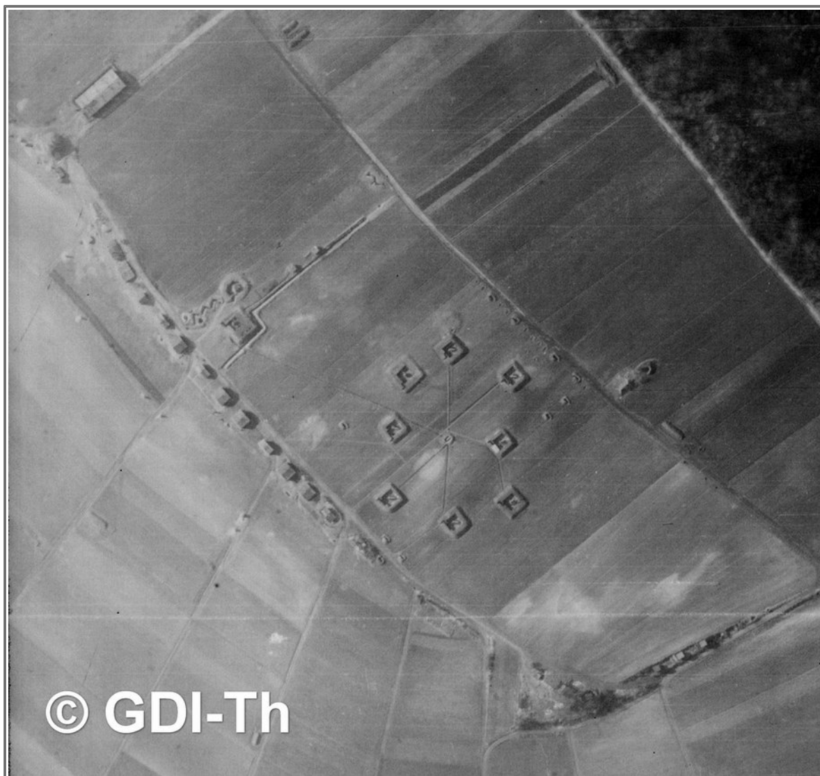
( Luftbild #3: Luftbildausschnitt – Flakstellung Coppanz bei Jena )

Flak-Stellung: Coppanz (bei Jena) Batterie/n & Abteilung/en: 3./s. 432 Art der Stellung (o/v/EIS): o Anzahl der Geschütze: 8x 8,8 cm Flak Nachgewiesen, wann: 03./04.1945 Luftwaffenhelfer: aus Greiz und Weida.