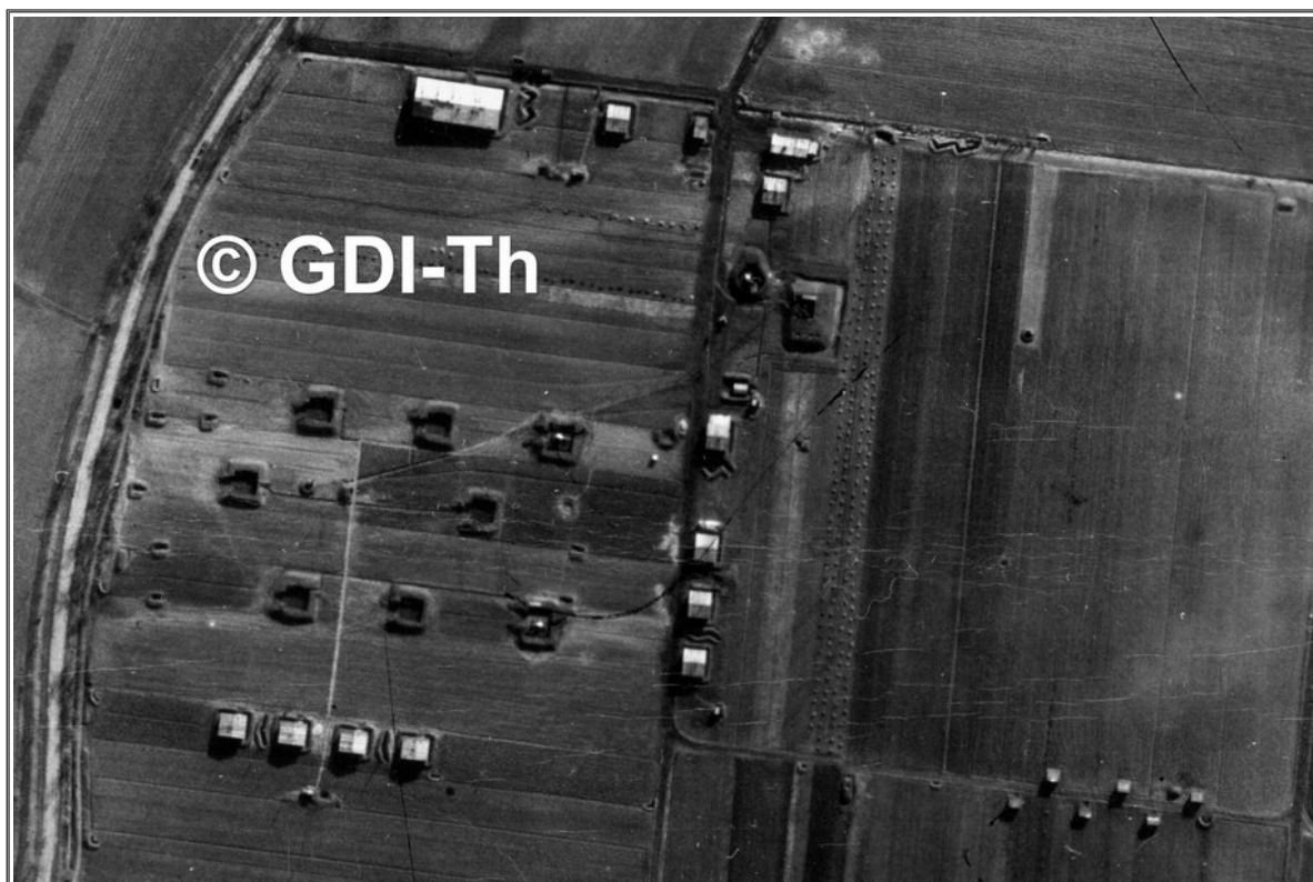
( Luftbild #6: Luftbildausschnitt – Flakbatterie Winzerla bei Jena )

Die historischen Luftbilder wurden vom Thüringer Landesamt für Vermessung und Geoinformation bereitgestellt und werden gemäß "Datenlizenz Deutschland - Namensnennung - Version 2.0" ( www.govdata.de/dl-de/by-2-0 ) genutzt. Das Luftbild wurde für die Veröffentlichung geändert.